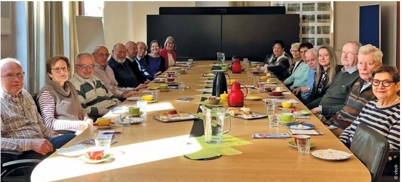
> Die gemeinsamen Treffen der Berliner Seniorinnen und Senioren werden gerne genutzt, um sich über die aktuellen Themen auszutauschen.